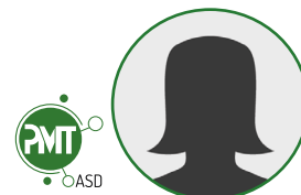
Malua de CARVALHO

12 permanents au service des adhérents et de la feuille de route